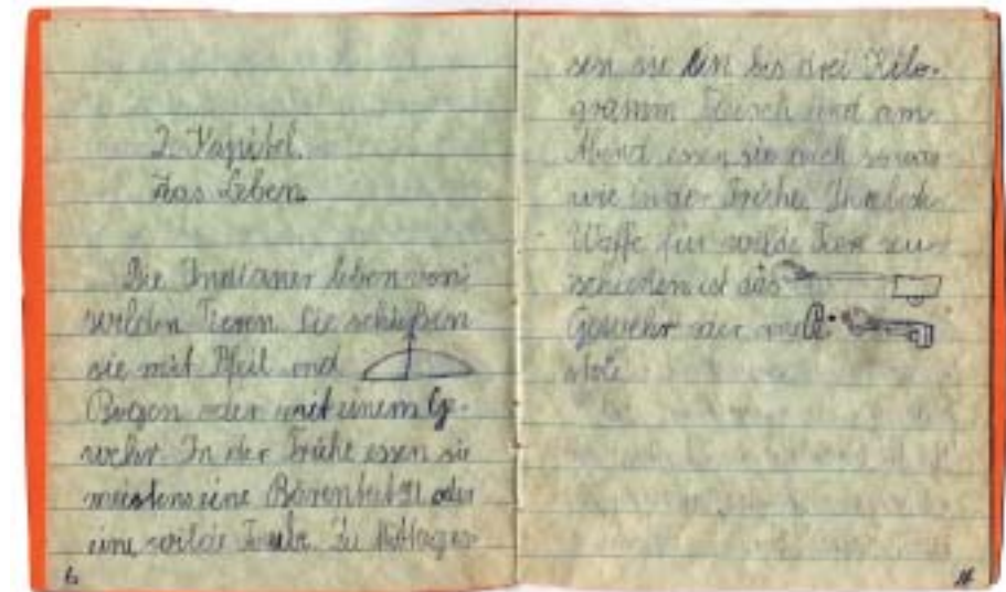
„Das Indianerbuch“, 1951